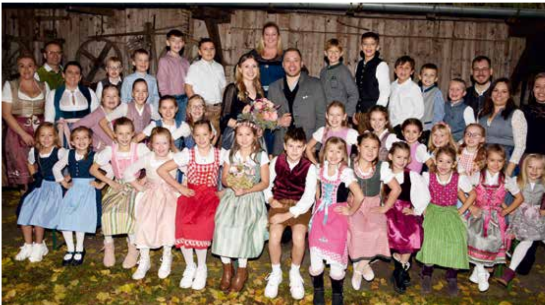
Da wächst etwas Temperamentvolles heran: Ihren ersten großen Auftritten fiebern die kleineren Kindergarten-Mädchen samt begleitenden Buben entgegen.