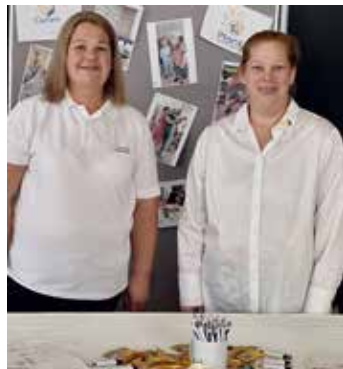
Beim Seniorentag in Pocking