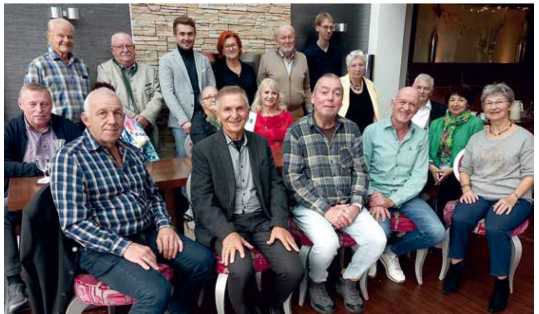
Die Senioren Union Pocking veranstaltete ein gemütliches Sonntagsfrühstück.