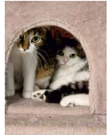
Die Katzen Miri und Maral