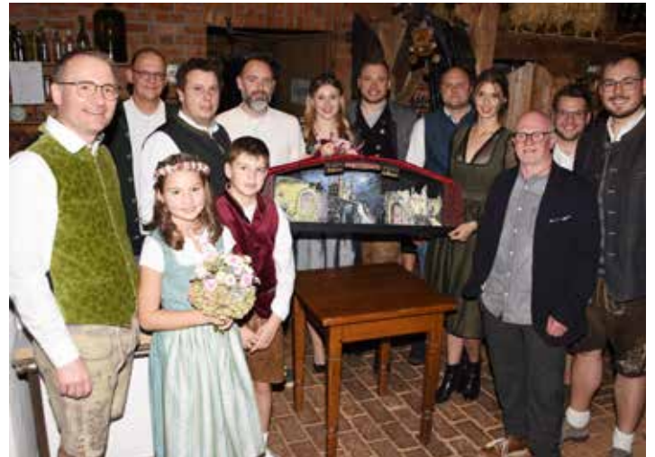
Mit großer Spannung erwartet wird bei jeder „Monster Party – Biss in den Morgen“ die Gaudianer-Revue, gestaltet vom „Show-Team“ (Hintergrund).