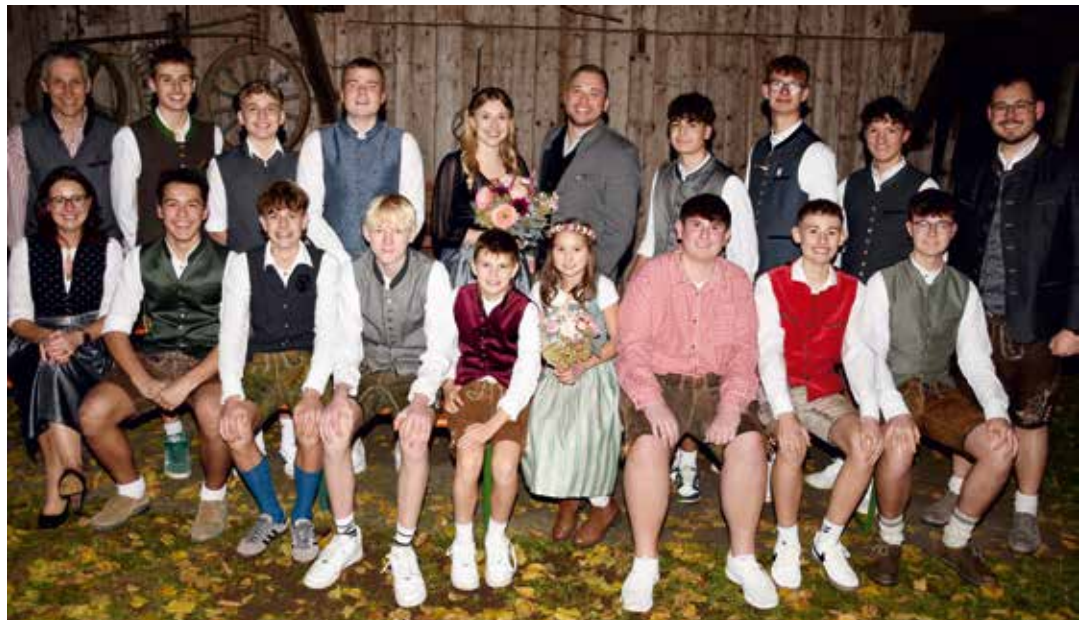
Rund ein gutes Dutzend fesch herausgeputzte Jugendelferräte begleiten die Ruhstorfer Gardemädchen im Fasching regelmäßig bei deren Auftritten.