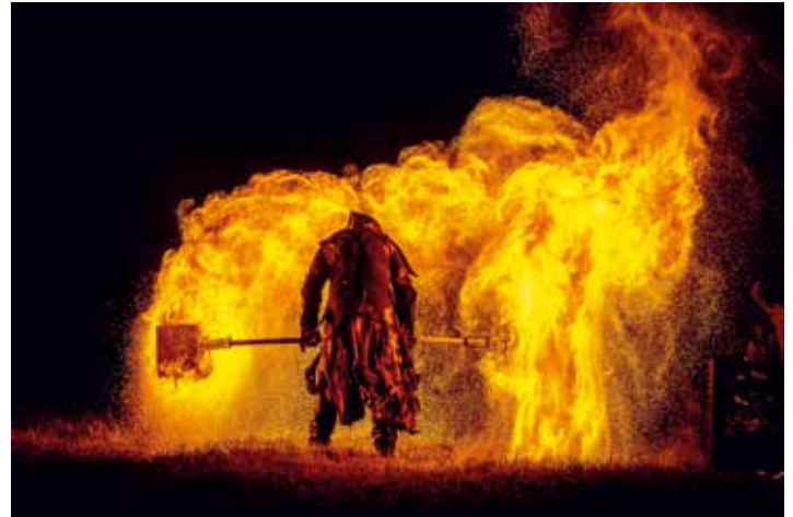
Feuershow der „Tiafabegga Feiadeifen“, die zum Abschluss am Sonntagabend auftreten werden.

16:00 Uhr - Tanzauftritt der Grundschule Pocking 16:30 Uhr - Auftritt ökumenischer Kinderchor CANTO LIBERO 17:00 Uhr - Besuch des Heiligen St. Nikolaus