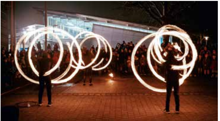
Am Samstag wartet auf alle Besucher eine spektakuläre Feuershow des Zirkus „Vui Hui“.