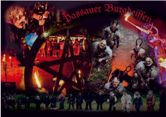
Die Perchtengruppe „Passauer Burgdeiffen“ läutet am Freitagabend das Wochenende am Weihnachtsmarkt ein.