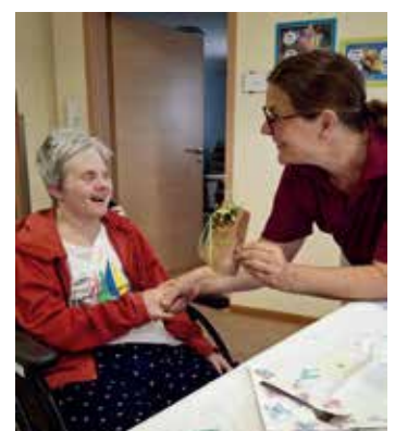
Freude bei der Geburtstagsfeier