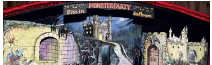
Ein phantastisches Bühnenbild von Ferdl Hinterwinkler erwartet beim nächsten Fasching wieder zigtausende Ballgäste in der Niederbayernhalle.

Monate lang die „Lust für Karneval, die bei der Mega-Monster-Party beim Gaudiwurm am Faschingssamstag unter höchstpersönlicher Schirm-