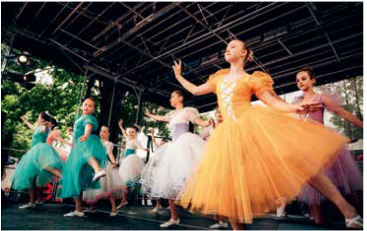
Auch das Ballett der vhs Passau wird wieder ein Programm darbieten.