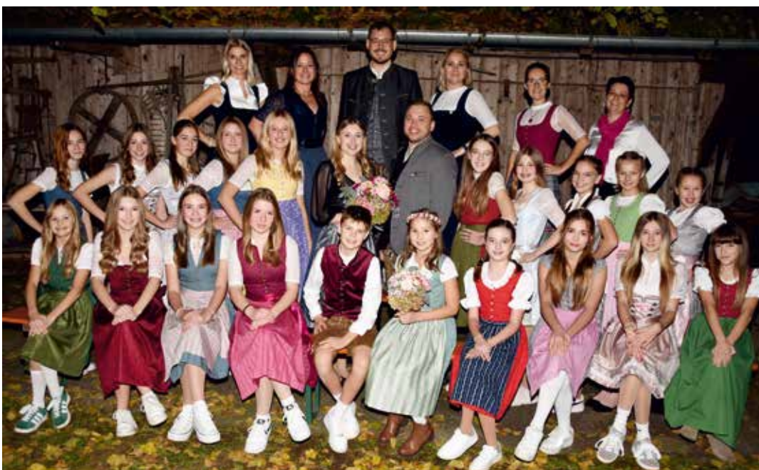
Die „Gaudianer-Hitkids“ ernten mit ihren fetzig einstudierten Showtänzen als talentierte „Garde-Sternchen“ stets verdienten Beifall beim Ruhstorfer Fasching.