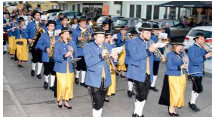
Mit klingendem Spiel gestaltete die Feuerwehr-Musikkapelle ihren Ausmarsch vom Gerätehaus durch das Marktzentrum zum „neuen Mathäser“-Probenraum.

Dass die Feuerwehr-Musikkapelle mittlerweile sogar zu den etablierten „Karpfhamer