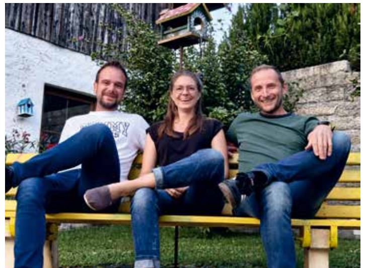
Die Band „3 of us“ freut sich auf Ihren Auftritt am Premiertag im Pockinger Stadtpark.