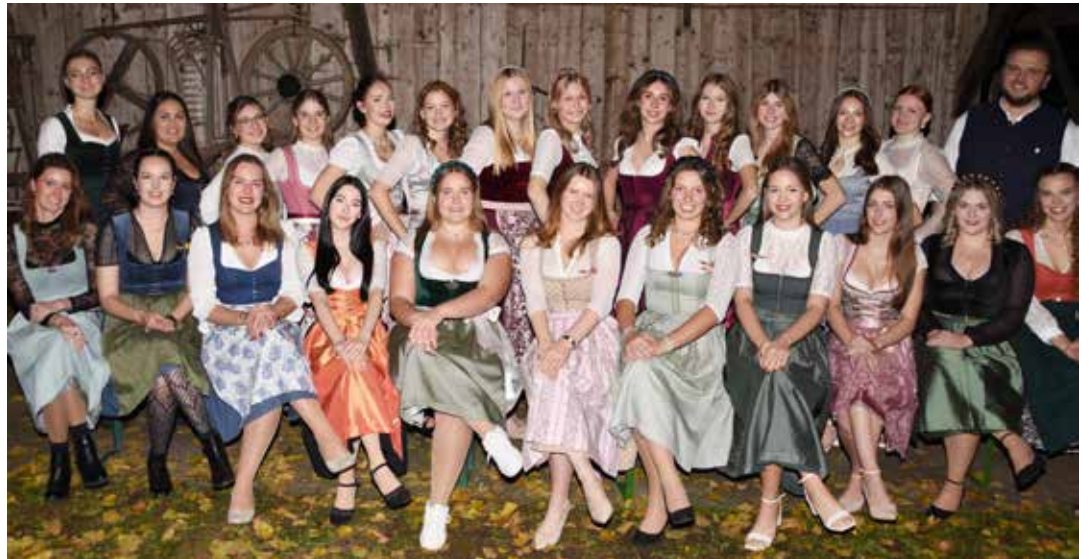
Lauter fesche Dirndl natürlich in bodenständiger Tracht: Die tanzbegeisterte „Teeny-Garde“ bildet das überaus engagierte Ruhstorfer „Nachwuchs-Ballett“.