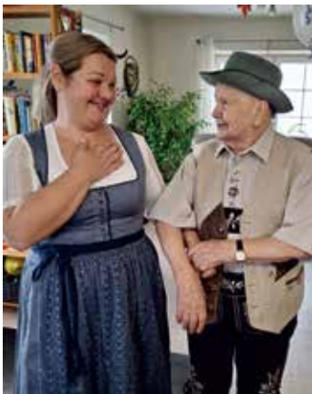
Zünftig war`s beim „Oktoberfest“.