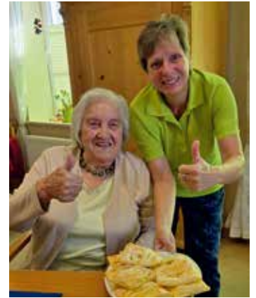
Frische Apfeltaschen

Zwischendurch dürfen wir auch die Jubeltage mit unseren Tagespflegegästen feiern, mit einem gesungenen Geburtstagsständchen und oft leckeren selbstgebackenen Torten oder Kuchen.