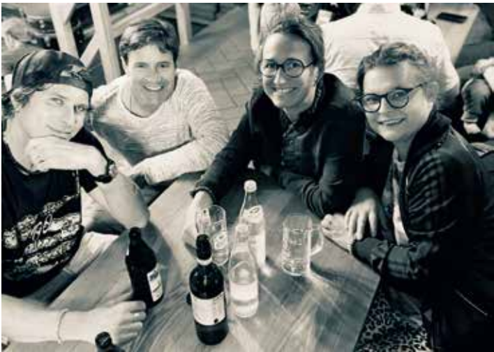
Die Band Tullamore Few wird am Samstagabend im Stadtpark Irische Folk-Musik zum Besten geben.